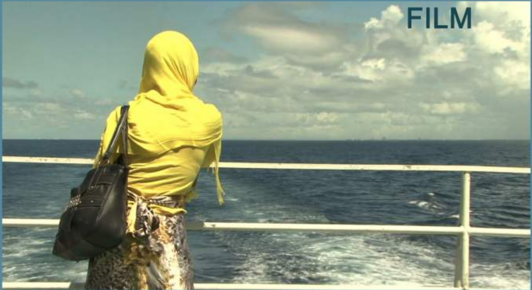
SAMIRA'S DREAM Regia di Nino Tropiano